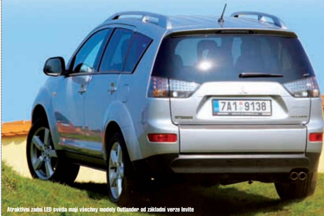
Atraktivní zadní LED světla mají všechny modely Outlander od základní verze Invite