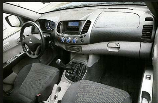
Řadičská páka se nachází blíže k řidiči

Japonský výrobce nehledá co nejnižší „cenu od“ a pro všechna provedení pracovního nástroje připravil pohon všech kol. Děje se tak v souladu s celou filozofií tohoto výrobce. Tři druhy kabin patří mezi pick-upy ke slušnému vychování, přestože v Česku málokdy zavadí o jinou než Double Cab. L200 proti konkurenci vůbec nešetří standardní výbavou, protože za příplatek si můžete pořídit leda metalický lak za nemalých 12 500 korun bez daně či prodlouženou záruku na pět let za stejný obnos. Kabát je velmi atraktivní. Přídíl ve stylu osobních vozů vypadá výhružně, oblé koncové svítilny se však podle našeho vkusu k čelní agresivitě moc nehodí.