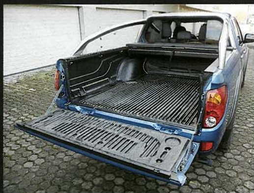
Ložná délka u Double Cabu činí 1325 mm

Mitsubishi coby specialista na pohon všech kol nabízí L200 výhradně jako 4x4 a přidává důmyslný pohon.