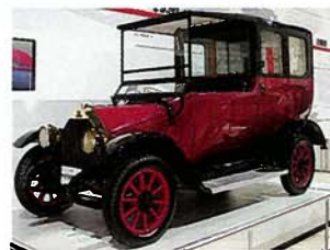
MODEL A Psal se rok 1917 a Mitsubishi postavilo první japonské auto.

J AKO INOVÁTOR SE ukázalo i v oblasti luxusu, když roku 1995 vyrobilo pro americký trh model 3000GT SL. Bylo to první sériové auto s elektronicky skládanou střechou. Stačilo jen zmáčknout tlačítko na palubní desce. V Evropě se tomuhle sportáku podobného vylepšení nedostalo.