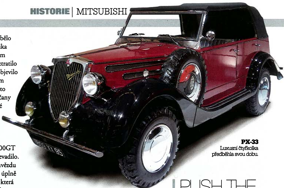
PX-33 Luxusní čtyřkolka předběhla svou dobu.