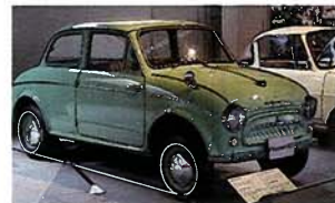
MITSUBISHI 500 První poválečné Mitsubishi dokázalo vyhrávat na závodních okruzích.